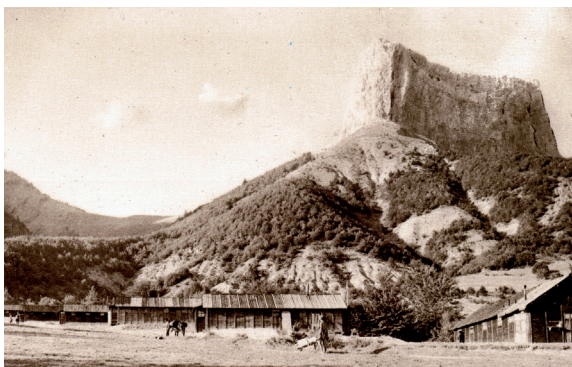
Camp des Chantiers de Jeunesse au pied du Mont Aiguille