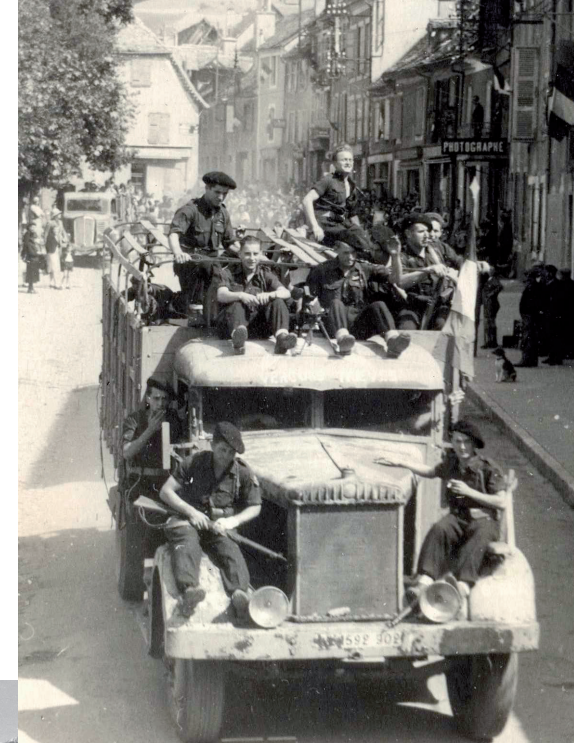
Août 1944, les maquisards à Mens

Élaborée de manière participative sur la base des travaux menés par les associations patrimoniales locales, cette exposition met en lumière l'histoire de ce territoire de moyenne montagne dans la tourmente de la guerre : la vie quotidienne, les chantiers de jeunesse, la Résistance, les maquis et le lien avec le Vercors, les personnes cachées, les événements militaires jusqu'à la Libération. Au-delà des faits, l'exposition s'interroge sur les commémorations et la transmission de cette histoire.