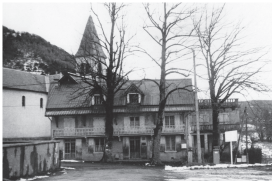
Préventorium de Prêlenfrey