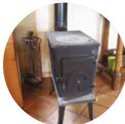
Poêle à bois