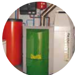
Chaudière à granulés