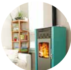
Poêle à granulés, fabriqué à La Mure

Il existe aujourd'hui un nombre incalculable de manière de brûler du bois pour se chauffer de façon pertinente. Cela va de la chaudière tout automatisée qui alimente un plancher chauffant ou un réseau de radiateurs, au poêle de masse qu'on peut construire soit même (à condition d'être bien renseigné ou bien conseillé !), en passant par le classique poêle à granulés. Il s'en construit même localement chez nos voisins Matheysins. Pour trouver le système qui correspond le mieux à vos besoins (et à vos moyens) faites vous conseiller par un spécialiste : soit un installateur qualifié, soit un conseiller indépendant.